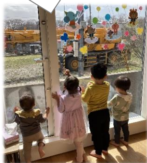
大きなクレーン車が来たよ!