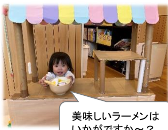
美味しいラーメンはいかがですか~?